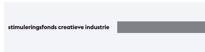
met langwerpige logo's