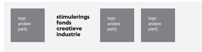
met vierkante logo's